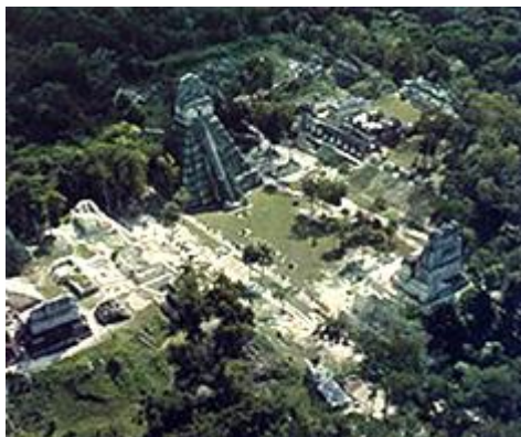
Le e nima'q ta ja rech Tikal rech le uq'ab' tinimit Petén.

Wa' we jun ch'aqa'p che ri kik'aslemal ri e mayib' ri' sib'alaj nim xil wi, rumal che ri k'i taq jastaq xkib'ano che ri sib'alaj je'lik. Xwokotaj k'ut ri jalajoj taq tinimit maya, jacha' ri: Tikal, Uaxactun, Piedras Negras, Quiriguá, Palenque, Copán, xuqje' nik'aj taq chik, chiri' lo kriqitaj wi je'lataq ja rech q'iji'lanik xuquje' nima'q taq ja. Ri b'anoj taq wachib'al choch taq ri ab'aj, sib'alaj xnimar lo choch ri xya'tajik are taq maja' kb'an ri k'i je'lataq jastaq xuquje' chech taq wa' we junab' ri' xkiwok ri cholq'ij maya, che ri are sib'alaj tz'aqat.