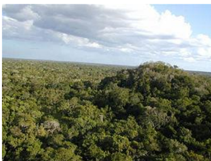
Uwachib'al le b'alam, pa le Kaye'b'al, chi 600 are taq maja' kk'iji' ri Jesus.

Che we ri' xuquje' are lo kb'ix chech jun ch'aqa'p che ri k'aslemal rech tikoq q'ayes, xa lo kamik sib'alaj ech'u'jarinaq ri e winaq, chech ri ub'ixik jas junab' lo xmajtaj loq xuquje' jas junab' xk'iy utz'am wa' we ri', kamik k'ut che ri are lo qas tzij rech kub'ij chi xmajtaj loq pa ri junab' kaq'o' lajk'al (en el año 1,000) are taq maja' kk'o'ji' ri Jesús, xk'is k'u utza'm pa ri junab' waqlajk'al are taq k'olinaq chi ri Jesús, (año 320 d.C.) chiri' lo xk'iy loq ri ch'ab'al maya, chiri' xkimajij ub'anik nima't taq tinimit.