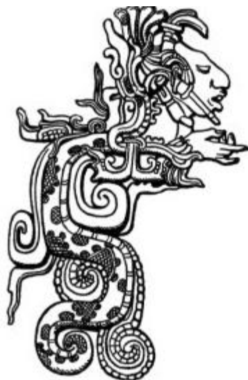
K'uk'ulkan are lo jun b'it'aj maya rech Quetzalcoáatl, jun winaq ri sib'alaj nim ub'anik pa we q'at rech kik'aslemal ri e mayib', kqil k'ut pa le jun wachib'al.

Wa' we jun q'at ri' are lo xya'taj pa taq ri junab' kaq'o' lajk'al-kajq'o' kajk'al wuqub' (años 1,000-1,687), pa ri q'at lajuj, (siglo X), xk'is lo are taq xe'b'u'l ri españolib' pa taq ri q'at waqlajuj, (siglo XVI), are taq k'olinaq chi ri Jesus, are taq ri e mayib' xkitzaqkanoq ri kik'olib'al rech taq q'iloj'nik, rech ri q'at jawje' xya'taj je'lataq jastaq, ri xe'b'anow wa' we jastaq pa we jun q'at ri' are lo enik'aj winaq che ri xe'q'axloq pa we tinimit che ri xaq junam kik'aslem kuk' ri e mayib', xuquje' k'o jun kik'aslemal jalom taq wi che ri k'o lo nik'aj kkib'ano che ri are no'jib'al nahuatl